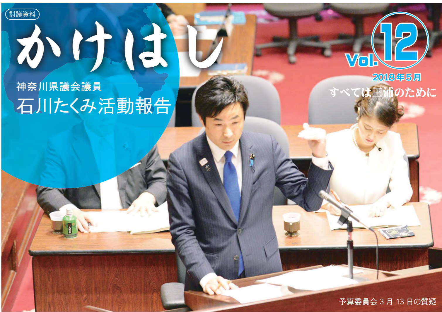
予算委員会 3月13日の質疑