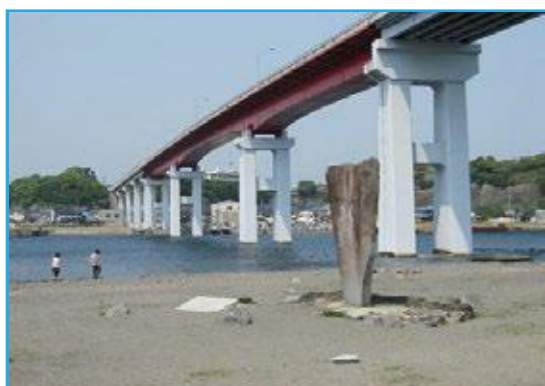
市政との「かけはし」に...

1973年1月21日三浦市海外町生まれ、現在初声町下宮田 在住 徳風幼稚園・三浦市立三崎小・三崎中学校 卒業 1992年 神奈川県立追浜高等学校 卒業 1996年 早稲田大学教育学部 卒業(東京都豊島区に下宿) 1996年 凸版印刷株式会社 入社(販促・営業) 2001年 有限会社丸石製作所入社(漁労機械・自動車整備販売) 2011年 公益社団法人三浦青年会議所 第50代理事長